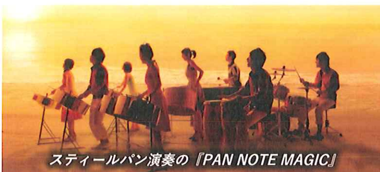
スティールパン演奏の『PAN NOTE MAGIC』