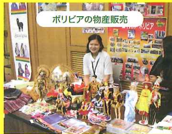
ボリビアの物産販売

レチョン(LECHON)(写真左)、マハデイト(MAJADITO)(写真右)などボリビア料理を販売します。日本ではあまり知られていないボリビア料理をこの機会にぜひ。