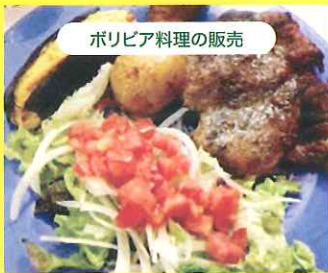
ボリビア料理の販売

アンデス地方の民族音楽、フォルクローレのコンサートです。素朴で美しい音色をお楽しみください。