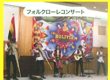
フォルクローレコンサート

ボリビアは様々な民俗舞踊があり、ダンスが盛んな国です。古くから伝わるダンスをお楽しみください。