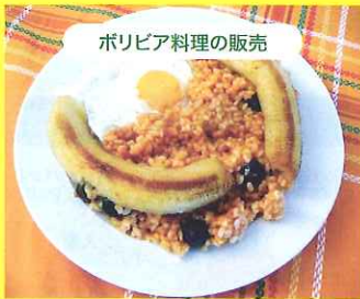
ボリビア料理の販売

レチョン(LECHON)(写真左)、マハデイト(MAJADITO)(写真右)などボリビア料理を販売します。日本ではあまり知られていないボリビア料理をこの機会にぜひ。