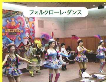
フォルクローレ・ダンス

日系人の歴史写真展、日本で暮らす日系人の生活の動画、ボリビア&日本文化イベント(和太鼓演奏・着物試着・抹茶体験/ボリビアのダンス・フォルクローレコンサート)、ふるさとイメージ絵画コンクール、ボリビアの物産販売