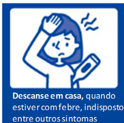
Descanse em casa, quando estiver com febre, indisposto entre outros sintomas