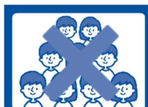
Evitar aglomeração de pessoas