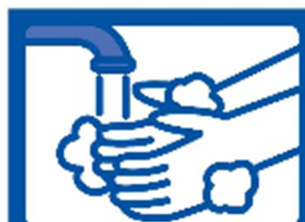
Lavar as mãos