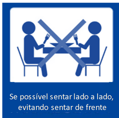
Se possível sentar lado a lado, evitando sentar de frente