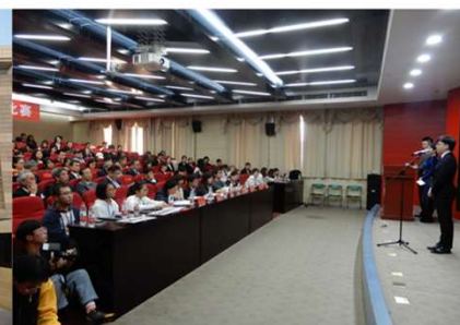
【江蘇大学日本語学科 日本語スピーチコンテスト】