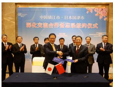
【35周年記念 青少年交流事業覚書署名式】

参加された学生には、今年度当協会が実施する鎮江市との交流事業へのご協力をお願いする場合があります。